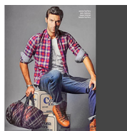
CROMIA PER E-COMMERCE