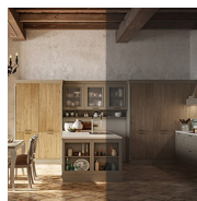
CROMIA PER RENDER